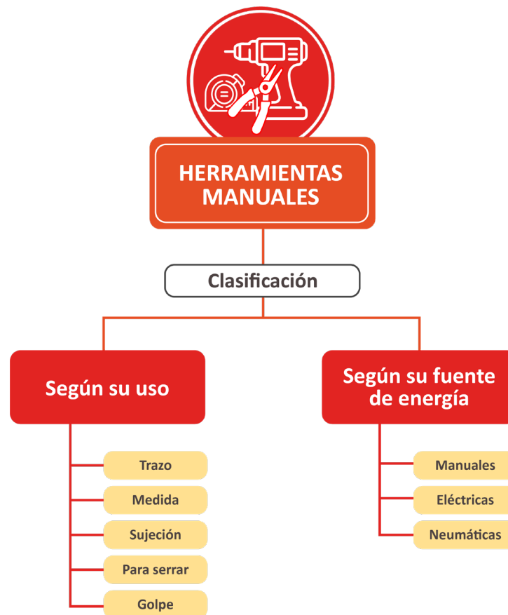
Figura 1. Mapa Conceptual Herramientas manuales

El objetivo de este documento, es promover la posibilidad de dar a conocer las herramientas manuales más usadas en los procedimientos involucrados en el sector de la construcción e infraestructura, fundamentales para el desarrollo de las acciones constructivas. El contenido está dividido en tres secciones: la primera, corresponde a la clasificación de herramientas según su uso; la segunda relaciona su fuente de energía y por último, se presentarán algunos consejos para su uso.